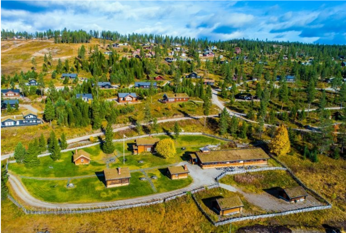
Figur 1. Oversiktsbilde over område F1 og Gamle Furutangen.

Gjeldende søknad om endring omfatter område F1 som er på 18 daa, og som bla. omfatter det gamle gårdsbruket kalt «Gamle Furutangen» som siden 2011 er benyttet til serverings- og samlingssted for hytteeiere og tilreisende. Området er regulert til forretning i gjeldende reguleringsplan. Det er behov for å videreutvikle området og ønskelig å åpne opp for at det innenfor planformålet også kan tilrettelegges for mindre leiligheter/rom for utleie, eller varme senger som er benevnelsen som benyttes i turistnæringen.